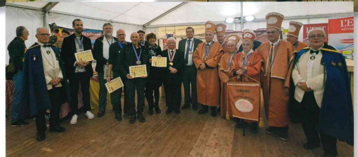
Sept nouveaux impétrants dans la Confrérie des Rillettes Comtoises fumées, dont Monsieur Michel VILBOIS, préfet de Haute-Saône.