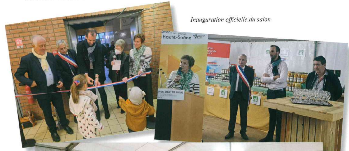
Inauguration officielle du salon.

Les 14, 15 et 16 octobre 2022 était organisé le 3eme Salon des vins et des saveurs par Epi 'cerise avec le concours de Sommellerie de France et de la Mairie de Quincey. Ce moment convivial a été très apprécié par les 950 visiteurs.