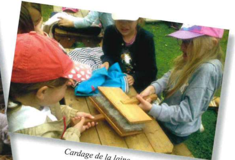
Cardage de la laine.