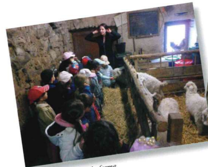
Visite de la ferme.

les classes de Petits/Moyens et de Grande Section/CP ont visité la ferme pédagogique de Perrine et Pierrot à Saint-Bresson