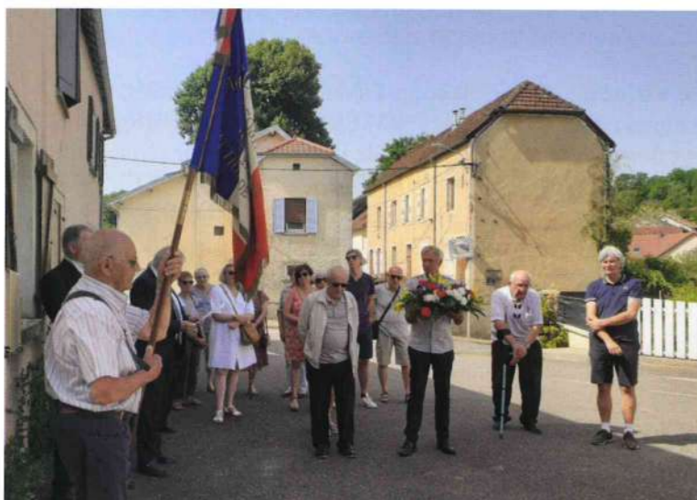
Commémoration de l'Appel du 18 juin 1940