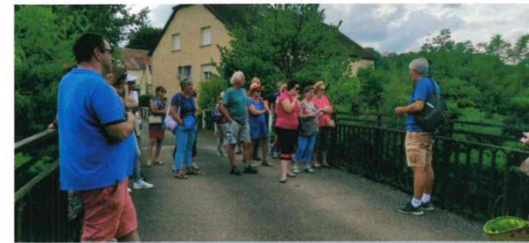
Découverte commentée de la commune de Quincey et de son patrimoine.

Ces deux sorties, en partenariat avec La Maison du Tourisme de l'agglomération de Vesoul, ont rencontré un franc succès et seront à nouveau proposées l'été prochain.