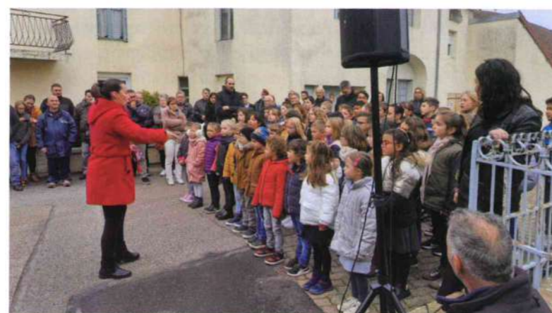
Cérémonie du 11 novembre avec la participation des enfants de l'école de Quincey.